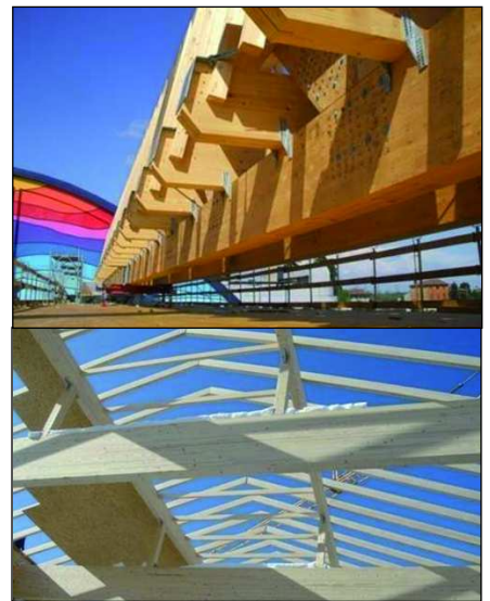
Komplexe Holzkonstruktionen aus der Abbundanlage: Tragwerk für eine Baustelle in Padua (oben), Dachstuhl für eine Kärntner Baustelle (unten)