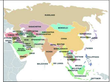
Wichtige Absatzmärkte: Nordafrika, Länder im Nahen Osten und Asien

Die, im Rundholzzentrum anfallenden, Kappstücke werden an die Stadtwärme Lienz geliefert. Die Einsatzbereiche des Hackgutes aus dem Sägewerk sind sehr vielfältig. Ein Teil davon wird für den Betrieb des Biomasse-Kraftwerks eingesetzt. Zusätzlich werden umliegende Fernwärmeversorger beliefert. Auch Papierproduzenten sowie Erzeuger von Textil-Zellstoff sind Abnehmer von heimischem Hackgut. Die Sägespäne und Hobelspäne werden