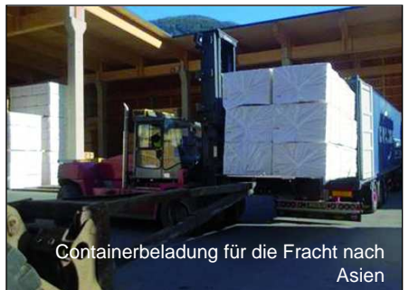
Containerbeladung für die Fracht nach Asien

an Spanplatten- und Pelletwerke sowie an Produzenten von Einstreuprodukten für die Landwirtschaft verkauft.