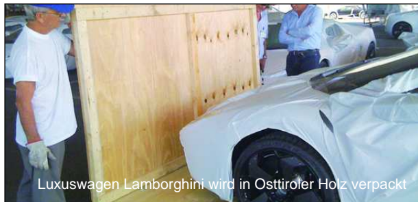
Luxuswagen Lamborghini wird in Osttiroler Holz verpackt

Aufgrund der hervorragenden Holzqualität sind die heimischen Erzeugnisse nicht nur in umliegenden Regionen gefragt. In Europa werden verschiedene Schnittholz-, Hobelware- sowie Brett-schichtholzprodukte abgesetzt. Eingesetzt werden diese als Bauprodukte, in der Weiterverarbeitung sowie als Transportschutz diverser Konsumgüter. Sogar Lamborghinis wurden bereits mit Osttiroler Holz verpackt.