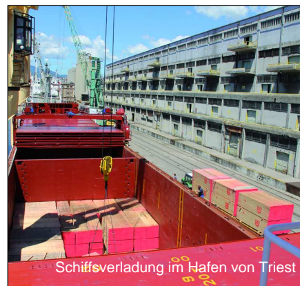
Schiffsverladung im Hafen von Triest

Die heimischen Erzeugnisse werden jedoch weit über die europäischen Grenzen hinaus geliefert. Vom arabischen Raum bis nach Pakistan sind sie sowohl im Bau als auch bei Produzenten von Verpackungsware im Einsatz. Auch nach Nordafrika, von Marokko bis